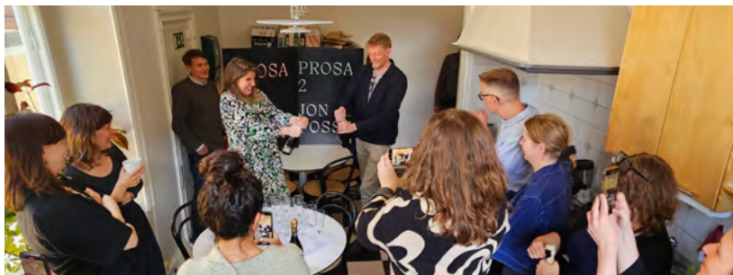
Vårt en skål. Glad stämning på Barnhusgatan när Nobelpristagaren annonserades.