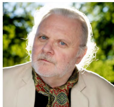
Nobels litteraturpristagare 2023: Jon Fosse