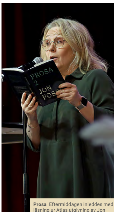
Prosa. Eftermiddagen inleddes med läsning ur Atlas utgivning av Jon Fosse.