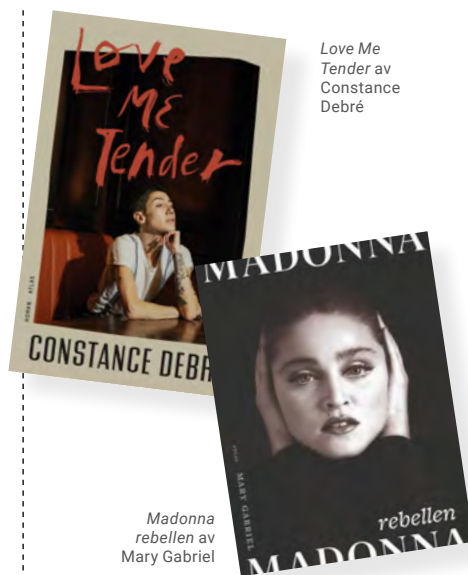
Love Me Tender av Constance Debré