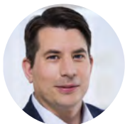
Jonas Nygren Bostad 2030