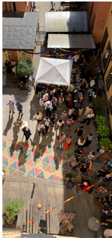
Sommarmingel på Barnhusgatan.

”I analysen av arbetsmiljöenkäten var lösningar på förbättrad återhämtning och lokalanvändning i fokus.”